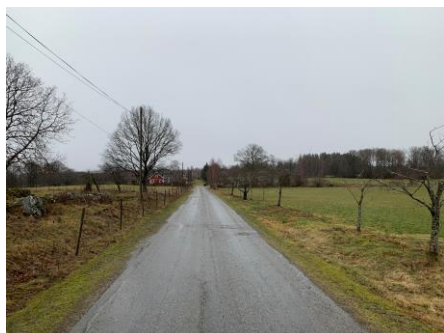
Vy från Kärrabol mot Levershult.