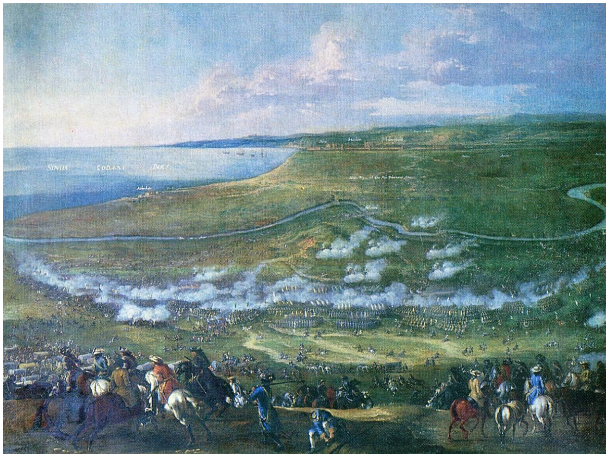
Slaget vid Fylllebro 1676. Målning av Johann Philip Lemke. I bakgrunden syns Halmstad med Galgerbetet, till höger byn Snöstorps