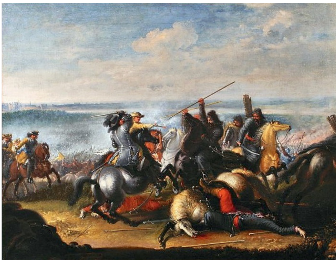
Slaget vid Warszawa 1656. Karl X Gustav i strid med Polska Tartararer. Målning av Johann Philip Lemke