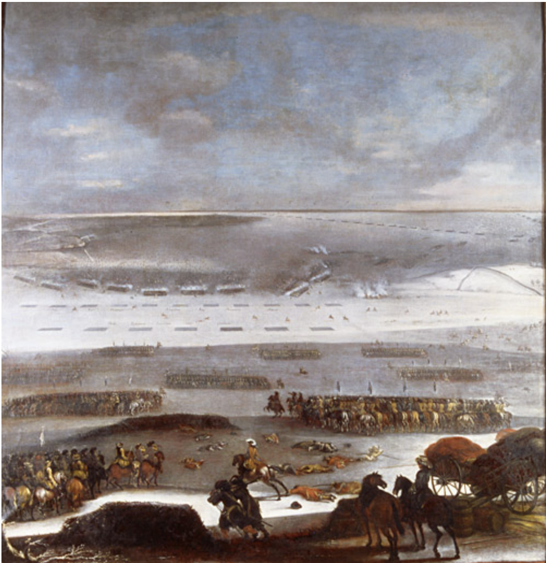
Tåget över Lilla Bält 1658. Svenskarna på isen. Målning av Johann Philip Lemke