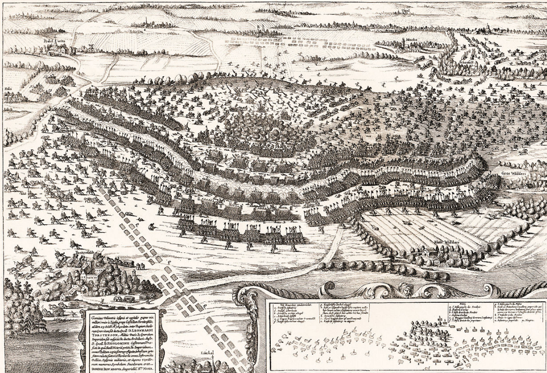
Slaget vid Leipzig 1642. Fältslaget och de kejsrerligas flykt. Kopparstick